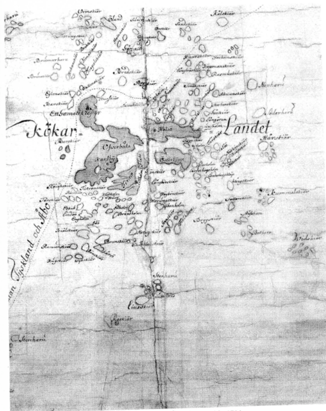
17. Kökarskärgården på Ålandskartan från 1714. Förbi Kökar löpte "Skieps- och Skutuleden emellan Tyskland och Åbo".

På Ålandskartan från 1714 går Skieps- och Skutuleden mellan Tyskland och Åbo förbi Kökar på utsidan om Kalen. Kartan utvisar även hur oberoende av varandra öarna är på fasta Kökar. Det som vi i dag kan skönja med lite fantasi är till exempel ängarna där Barnängen och Sommarängen ligger i dag.